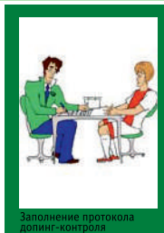
Заполнение протокола допинг-контроля